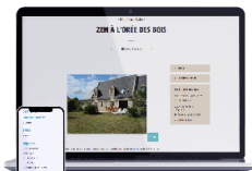
EXEMPLE DE PAGE DÉTAILLÉE Site responsive design

www.tourainenature.com/espace-partenaires/organisateurs-annoncez-votre-evenement/